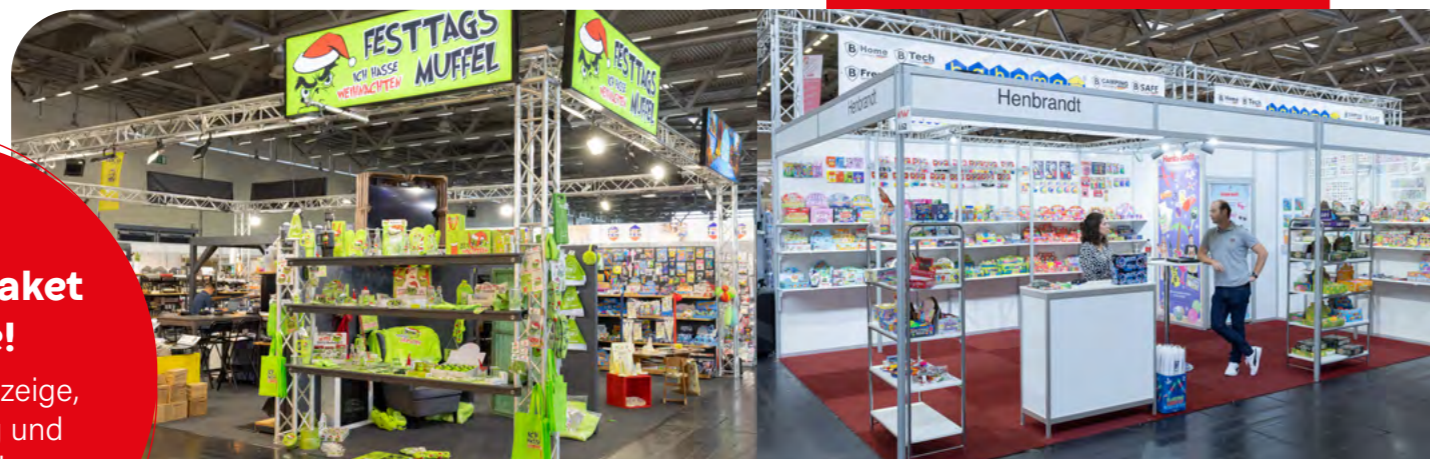
Die Bilder zeigen lediglich Standbeispiele incl. Zusatzausstattung. Für genaue Informationen, kontaktieren Sie uns gerne.

Doppelseitige Anzeige, Bannerwerbung und viele mehr!